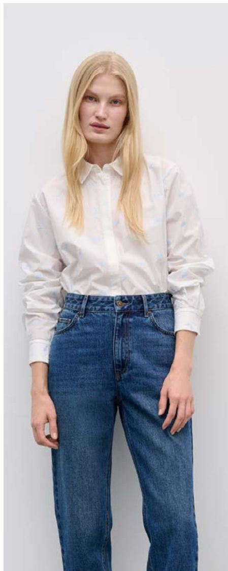
БЛУЗКА Артикул: 3604/401 Состав: 100% хлопок Цена: 10 990 ₺