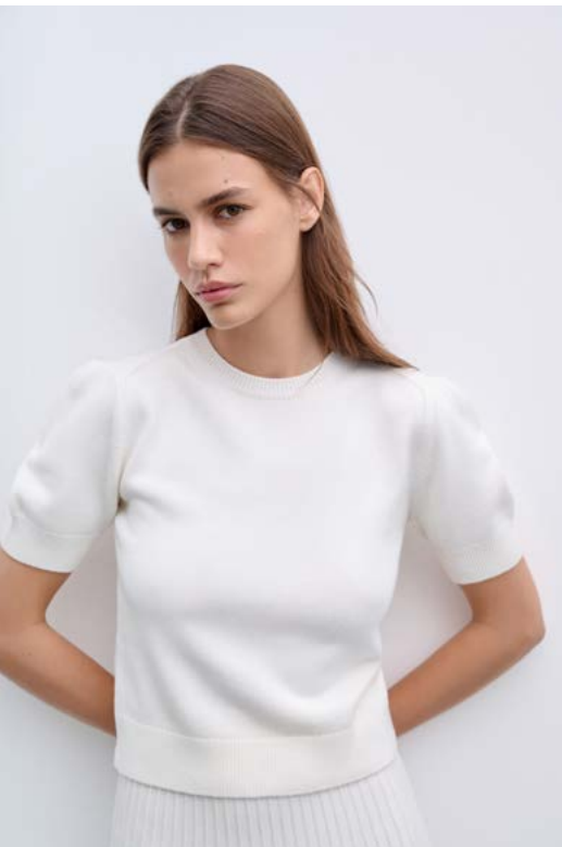
ДЖЕМПЕР Артикул: 3600/113 Состав: 30% мериносовая шерсть, 35% вискоза, 35% нейлон Цена: 8 990 Р