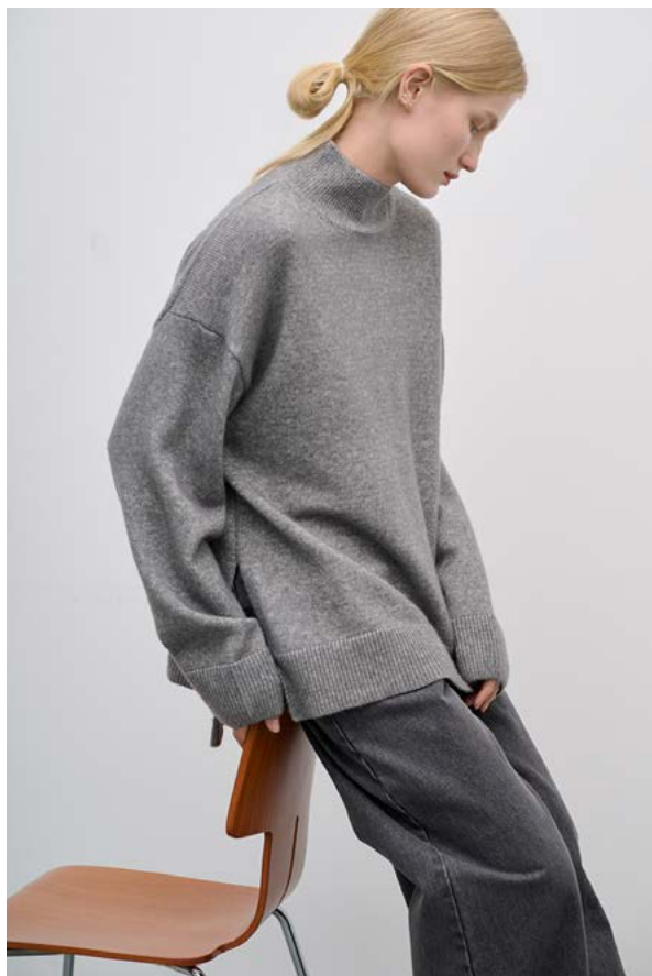
ДЖЕМПЕР АРТИКУЛ: 3688/409 СОСТАВ: 45% ХЛОПОК, 32% ШЕРСТЬ, 23% НЕЙЛОН ЦЕНА: 17 990 Р