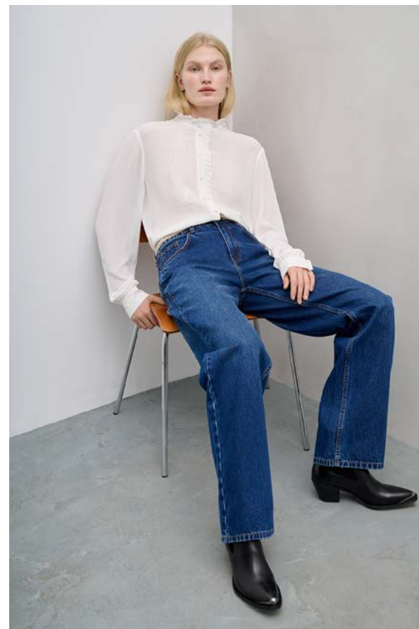
ДЖИНСЫ АРТИКУЛ: 3603/116 СОСТАВ: 100% ХЛОПОК ЦЕНА: 10 990 Р