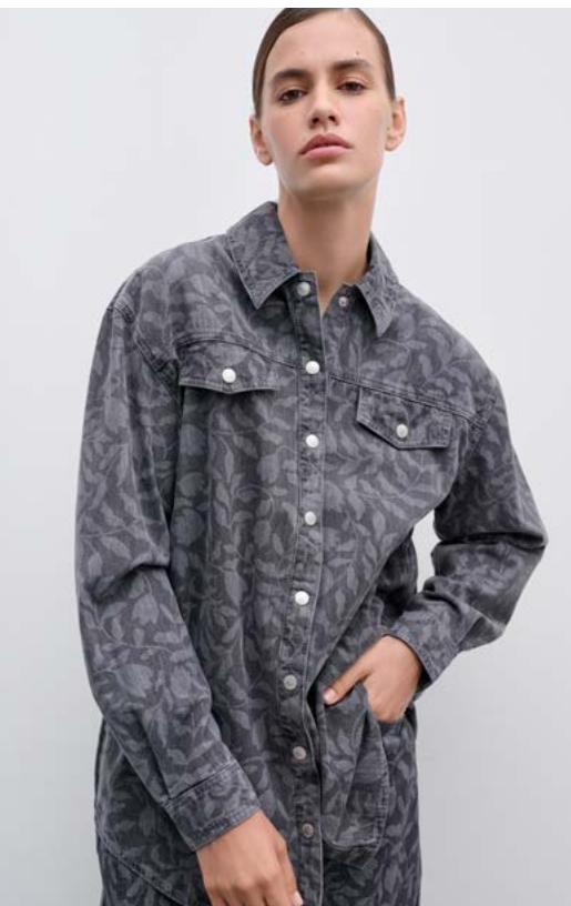
БЛУЗА Артикул: 3702/209 Состав: 100% хлопок Цена: 13 990 руб