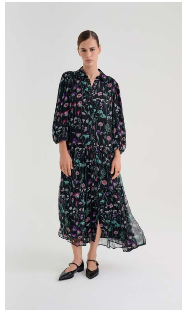
ПЛАТЬЕ Артикул: 3761/203 Состав: 100% Вискоза Цена: 18 990 Р