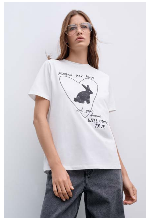
ФУТБОЛКА АРТИКУЛ:3792/402 СОСТАВ: 94% ХЛОПОК, 6% ЭЛАСТАН ЦЕНА: 5 990 ₺