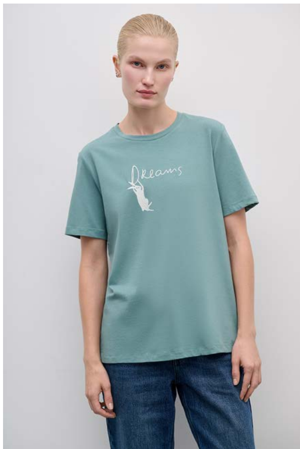
ФУТБОЛКА АРТИКУЛ: 3795/407 СОСТАВ: 95% ХЛОПОК, 5% СПАНДЕКС ЦЕНА: 5 990 ₺