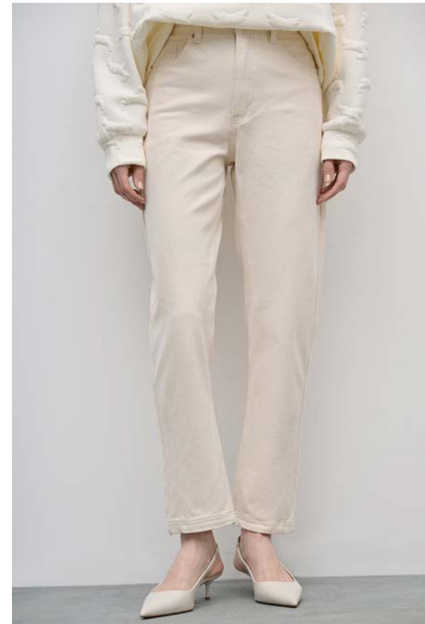
ДЖИНСЫ АРТИКУЛ: 3602/113 СОСТАВ: 100% ХЛОПОК ЦЕНА: 10 990 Р