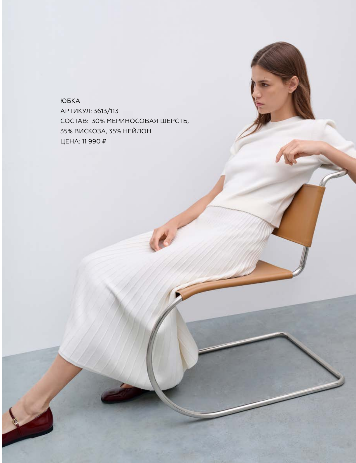
ЮБКА Артикул: 3613/113 Состав: 30% мериносовая шерсть, 35% вискоза, 35% нейлон Цена: 11 990 Р