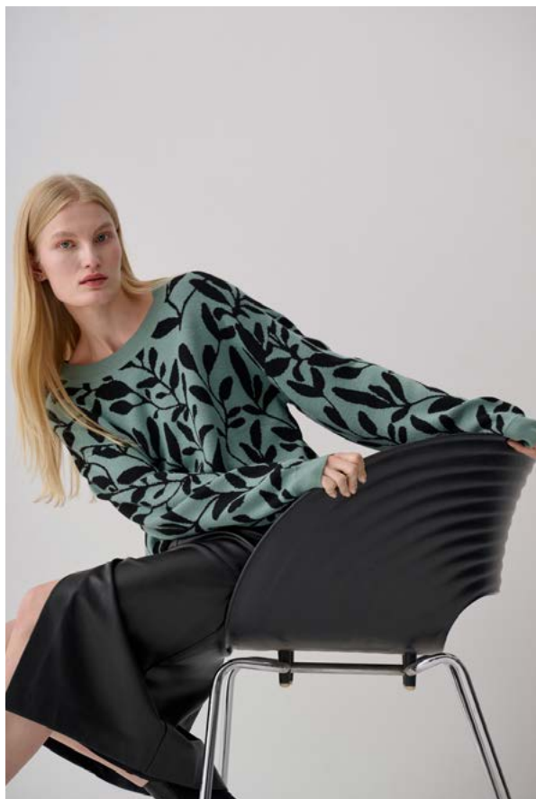
ДЖЕМПЕР АРТИКУЛ: 3764/707 СОСТАВ: 40% ВИСКОЗА, 30% НЕЙЛОН, 27% ПОЛИЭСТЕР, 3% КАШЕМИР ЦЕНА: 10 990 Р