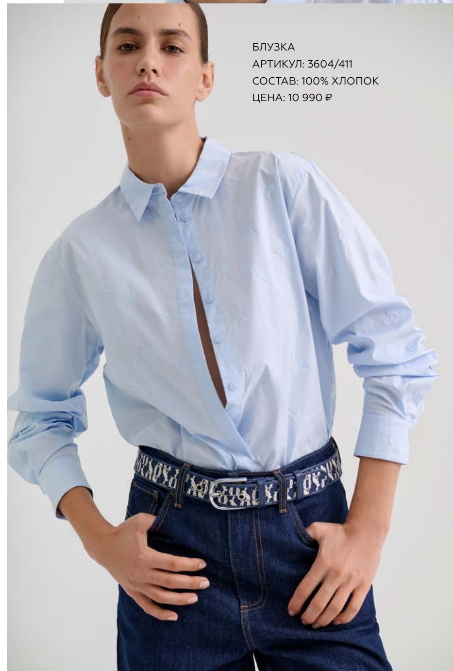
БЛУЗКА Артикул: 3604/411 Состав: 100% хлопок Цена: 10 990 ₺