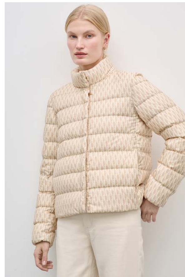
КУРТКА АРТИКУЛ: 3615/219 СОСТАВ: 90% ПУХ, 10% ПЕРО ЦЕНА: 19 990 Р