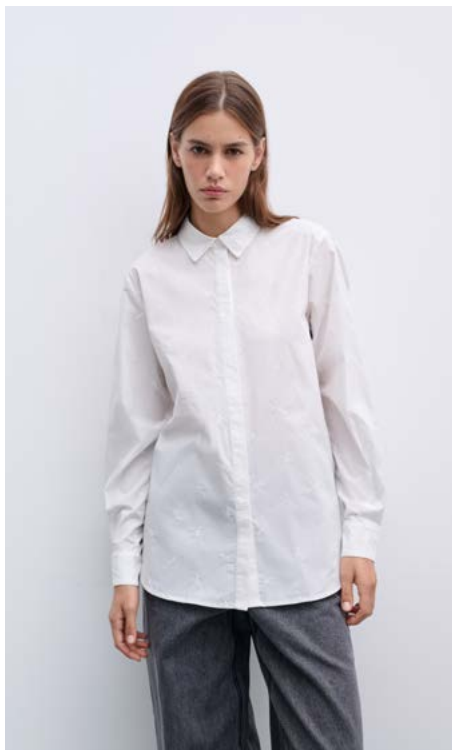
БЛУЗКА Артикул: 3604/402 Состав: 100% хлопок Цена: 10 990 ₺