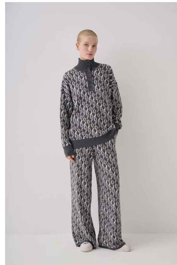
ДЖЕМПЕР Артикул: 3677/709 Состав: 40% Вискоза, 30% нейлон, 27% полиэстер, 3% кашемир Цена: 13 990 ₺