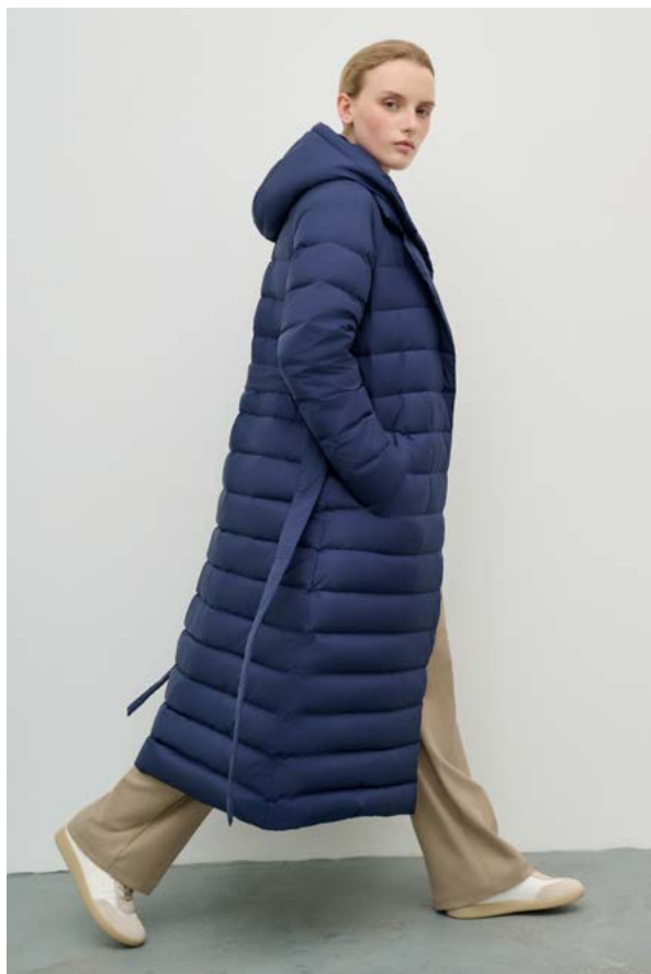
ПАЛЬТО АРТИКУЛ: 3750/104 СОСТАВ: 100% ПОЛИЭСТЕР ЦЕНА: 29 990 Р