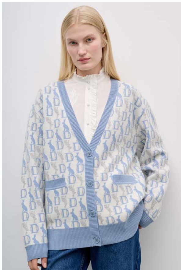
КАРДИГАН АРТИКУЛ: 3676/711 СОСТАВ: 100% МЕРИНОСОВАЯ ШЕРСТЬ ЦЕНА: 15 990 Р