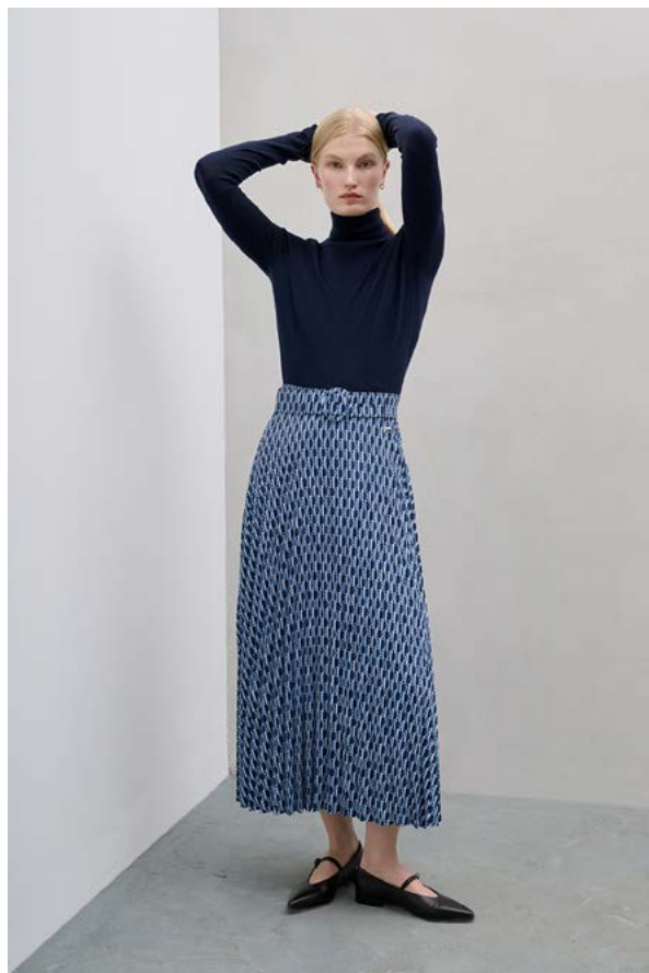
ЮБКА АРТИКУЛ: 3610/201 СОСТАВ: 100% ПОЛИЭСТЕР ЦЕНА: 12 990 Р