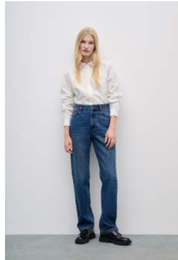
ДЖИНСЫ АРТИКУЛ: 3786/116 СОСТАВ: 100% ХЛОПОК ЦЕНА: 10 990 Р