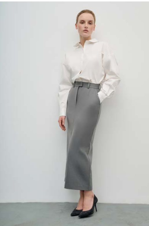
ЮБКА Артикул: 3763/109 Состав: 62% Полиэстер, 35% Вискоза, 3% Эластан Цена: 9 990 Р