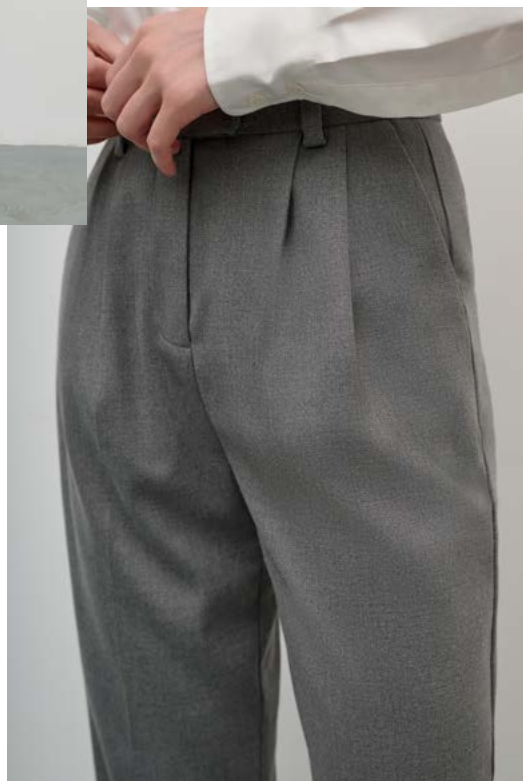
БРЮКИ Артикул: 3647/109 Состав: 62% Полиэстер, 35% Вискоза, 3% Эластан Цена: 11 990 Р