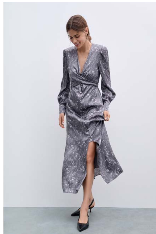
ПЛАТЬЕ АРТИКУЛ: 3705/209 СОСТАВ: 51% ВИСКОЗА, 49% РАЙОН ЦЕНА: 19 990 ₺