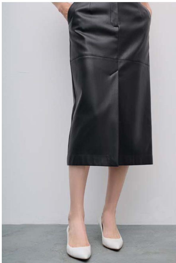
ЮБКА АРТИКУЛ: 3691/103 СОСТАВ: 100% ПОЛИЭСТЕР С ПОКРЫТИЕМ 100% ПОЛИУРЕТА ЦЕНА: 10 990 ₽