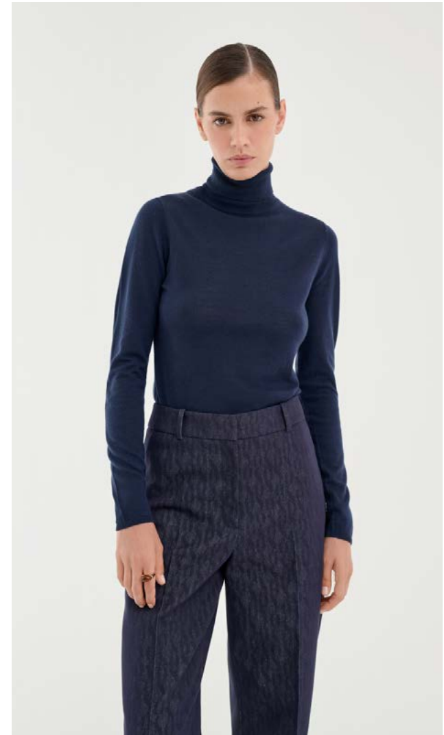
ДЖЕМПЕР Артикул: 3771/104 Состав: 100% мериносовая шерсть Цена: 8 990 Р