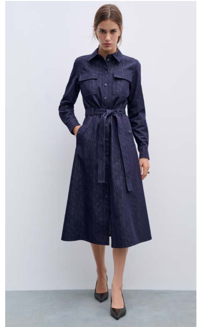
ПЛАТЬЕ Артикул: 3626/704 Состав: 56% хлопок, 41% полиэстер, 3% эластан Цена: 19 990 ₺