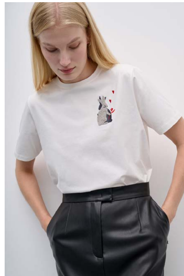
ФУТБОЛКА АРТИКУЛ: 3796/402 СОСТАВ: 94% ХЛОПОК, 6% ЭЛАСТАН ЦЕНА: 5 990 ₺