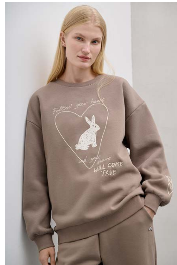
ТОЛСТОВКА АРТИКУЛ: 3789/408 СОСТАВ: 82% ХЛОПОК, 18% ПОЛИЭСТЕР ЦЕНА: 11 990 Р