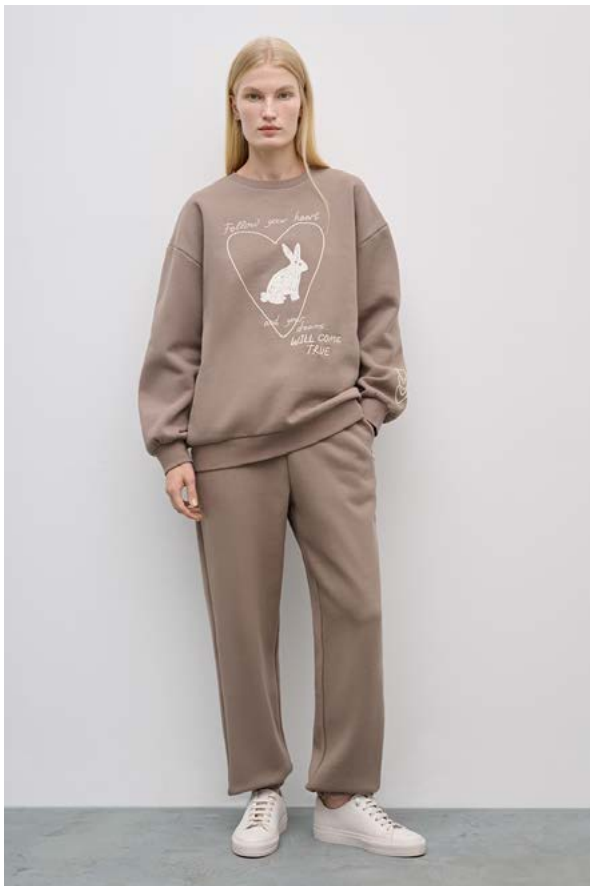
БРЮКИ АРТИКУЛ:3790/108 СОСТАВ: 82% ХЛОПОК, 18% ПОЛИЭСТЕР ЦЕНА: 8 990 Р