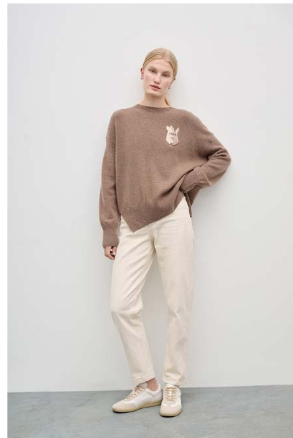
ДЖЕМПЕР АРТИКУЛ: 3791/419 СОСТАВ: 90% ШЕРСТЬ, 10% КАШЕМИР ЦЕНА: 18 990 Р