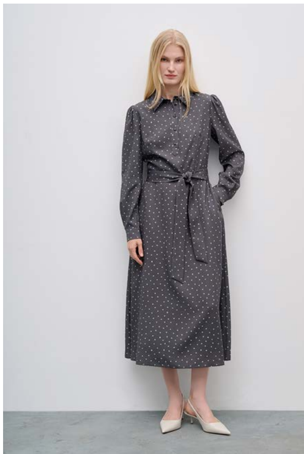
ПЛАТЬЕ АРТИКУЛ: 3687/209 СОСТАВ: 100% ТЕНСЕЛЬ ЦЕНА: 17 990 Р