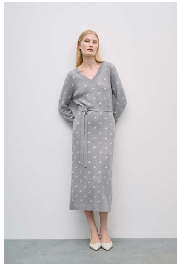
ПЛАТЬЕ АРТИКУЛ: 3607/709 СОСТАВ: 40% ВИСКОЗА, 30% НЕЙЛОН, 27% ПОЛИЭСТЕР, 3% КАШЕМИР ЦЕНА: 14 990 ₺