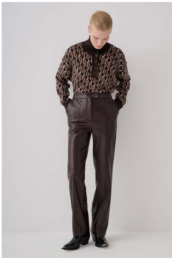
БРЮКИ АРТИКУЛ: 3692/103 СОСТАВ: 100% ПОЛИЭСТЕР С ПОКРЫТИЕМ 100% ПОЛИУРЕТАН ЦЕНА: 10 990 Р