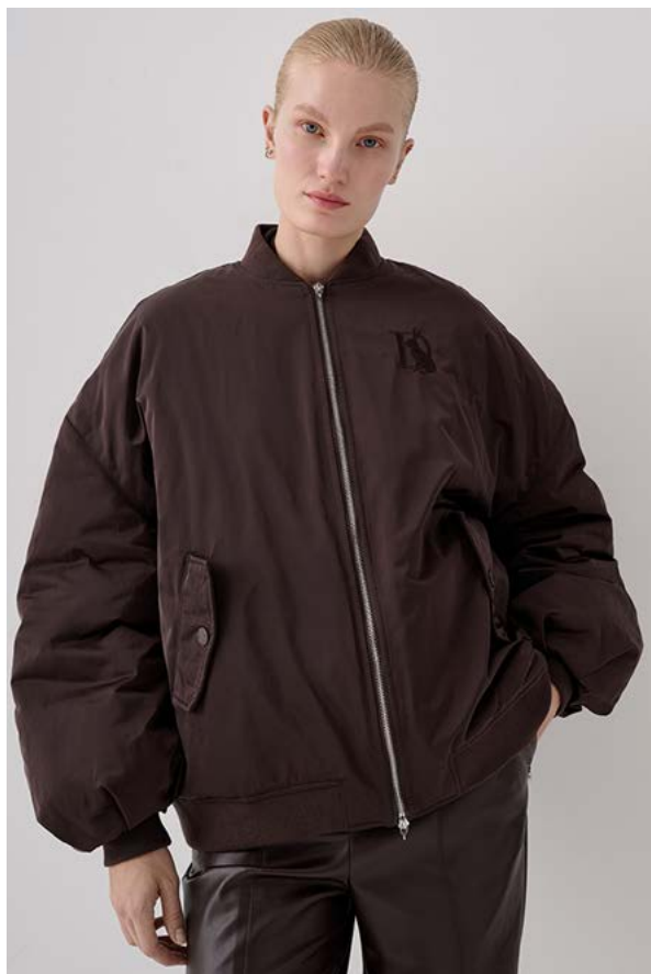
БОМБЕР АРТИКУЛ: 3749/108 СОСТАВ: 100% ПОЛИЭСТЕР ЦЕНА: 19 990 Р