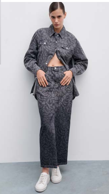
ЮБКА Артикул: 3703/209 Состав: 100% хлопок Цена: 12 990 руб