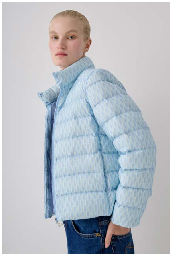
КУРТКА АРТИКУЛ: 3615/211 СОСТАВ: 90% ПУХ, 10% ПЕРО ЦЕНА: 19 990 Р