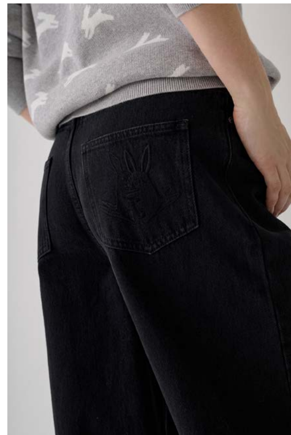
ДЖИНСЫ АРТИКУЛ: 3794/403 СОСТАВ: 100% ХЛОПОК ЦЕНА: 11 990 ₺