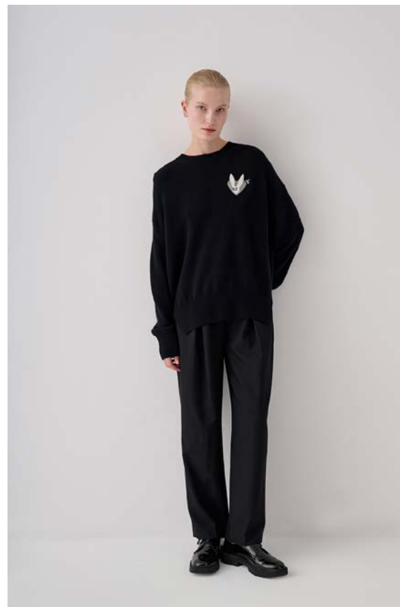
ДЖЕМПЕР АТИКУЛ: 3791/403 СОСТАВ: 90% ШЕРСТЬ, 10% КАШЕМИР ЦЕНА: 18 990 Р