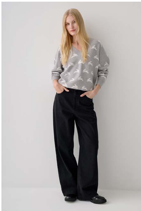
ДЖЕМПЕР АРТИКУЛ: 3611/709 СОСТАВ: 95% ХЛОПОК, 5% КАШЕМИР ЦЕНА: 11 990 ₺