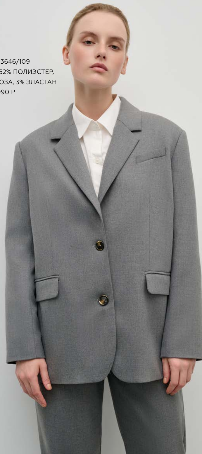
ЖАКЕТ Артикул: 3646/109 Состав: 62% Полиэстер, 35% Вискоза, 3% Эластан Цена: 19 990 Р