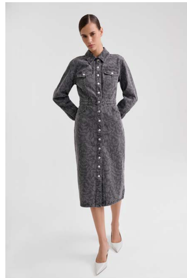
ПЛАТЬЕ АРТИКУЛ: 3704/209 СОСТАВ: 100% ХЛОПОК ЦЕНА: 19 990 ₺