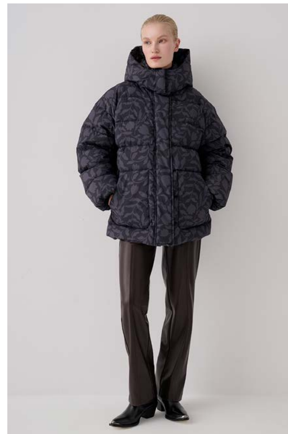
КУРТКА АРТИКУЛ: 3714/209 СОСТАВ: 100% НЕЙЛОН, 90% ПУХ, 10% ПЕРО ЦЕНА: 39 990 ₺