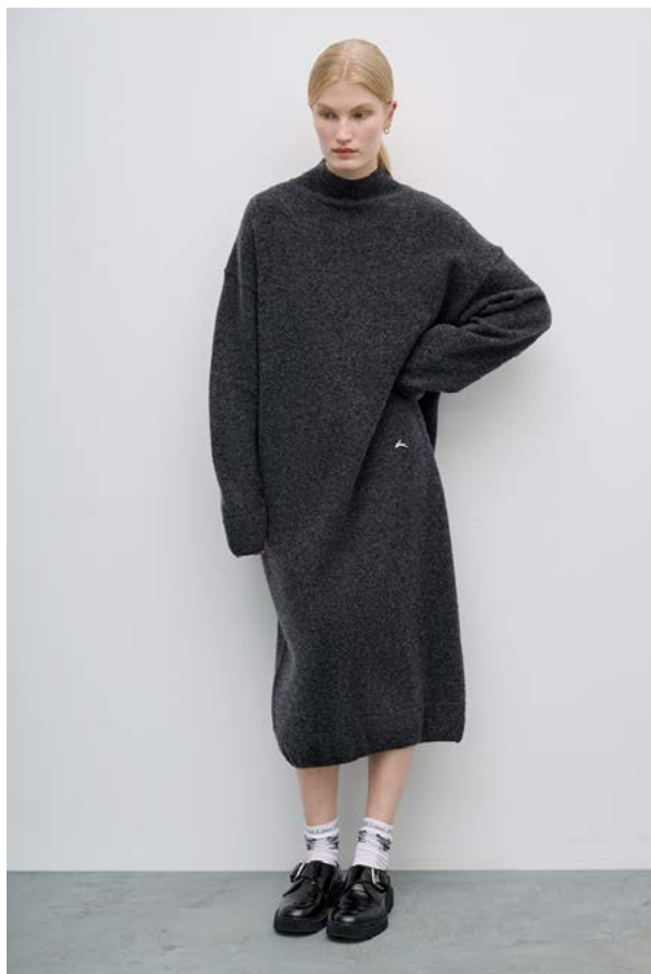
ПЛАТЬЕ АРТИКУЛ: 3686/109 СОСТАВ: 45% ХЛОПОК, 32% ШЕРСТЬ, 23% НЕЙЛОН ЦЕНА: 19 990 ₺