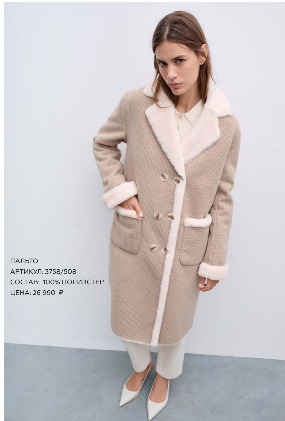
ПАЛЬТО АРТИКУЛ: 3758/508 СОСТАВ: 100% ПОЛИЭСТЕР ЦЕНА: 26 990 Р