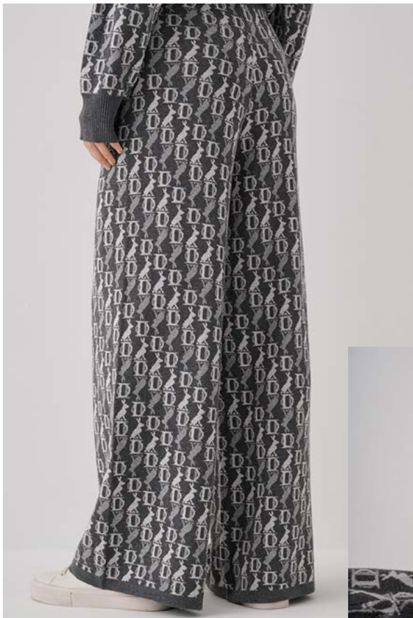
БРЮКИ Артикул: 3678/709 Состав: 40% Вискоза, 30% нейлон, 27% полиэстер, 3% кашемир Цена: 11 990 ₺