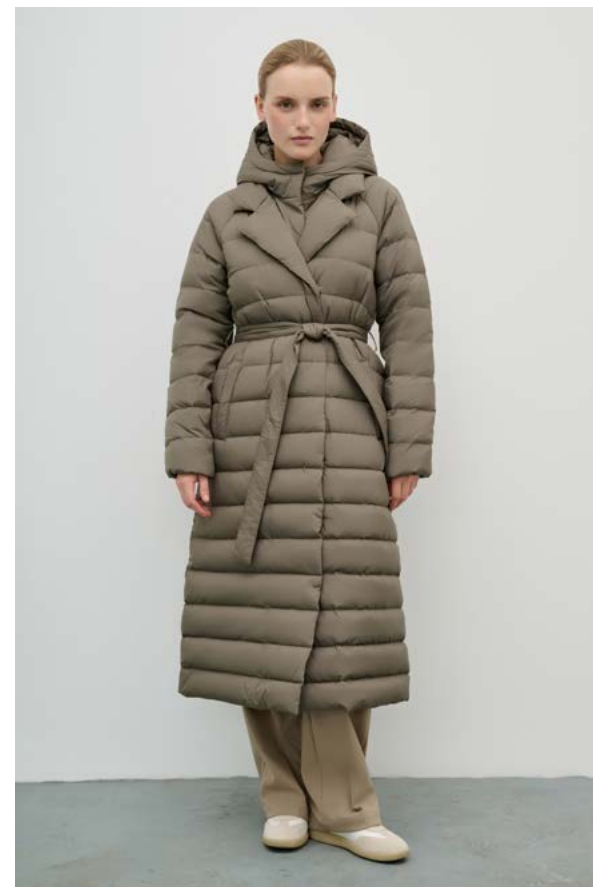
ПАЛЬТО АРТИКУЛ: 3750/109 СОСТАВ: 100% ПОЛИЭСТЕР ЦЕНА: 29 990 Р