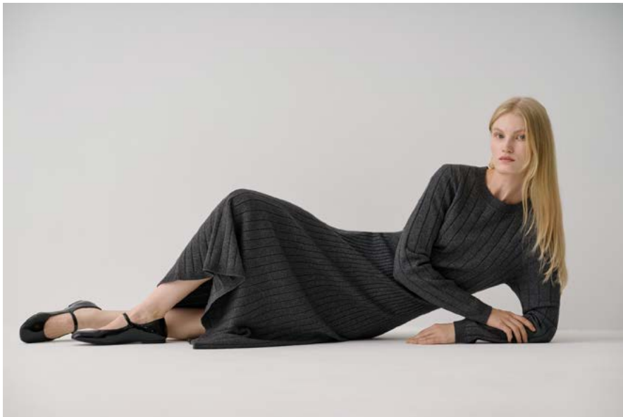
ПЛАТЬЕ Артикул: 3774/109 Состав: 39% Полиамид, 27% Акрил, 21% Шерсть, 13% Полиэстер Цена: 16 990 руб