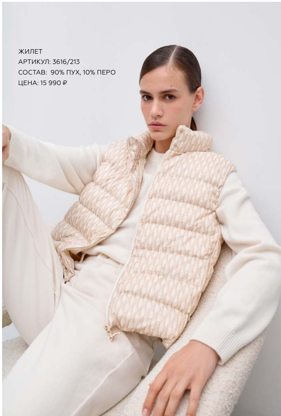
ЖИЛЕТ АРТИКУЛ: 3616/213 СОСТАВ: 90% ПУХ, 10% ПЕРО ЦЕНА: 15 990 Р