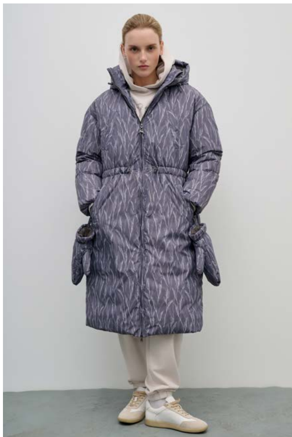
ПАЛЬТО АРТИКУЛ: 3721/209 СОСТАВ: 100% ПОЛИЭСТЕР С ВОДОНЕПРОНИЦАЕМОЙ ПРОПИТКОЙ, 90% ПУХ, 10% ПЕРО ЦЕНА: 42 990 ₺