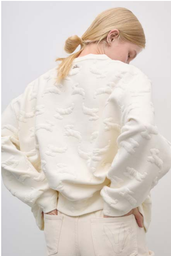
ТОЛСТОВКА АРТИКУЛ: 3757/713 СОСТАВ: 55% ХЛОПОК, 41% ПОЛИЭСТЕР, 4% ЭЛАСТАН ЦЕНА: 9 990 Р