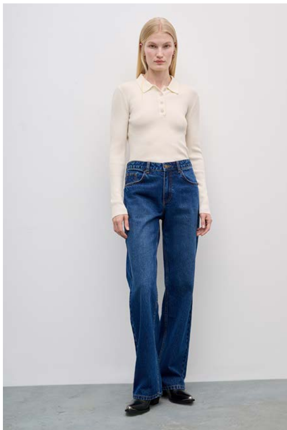
ДЖЕМПЕР АРТИКУЛ: 3675/102 СОСТАВ: 90% МЕРИНОСОВАЯ ШЕРСТЬ, 10% НЕЙЛОН ЦЕНА: 8 990 ₺