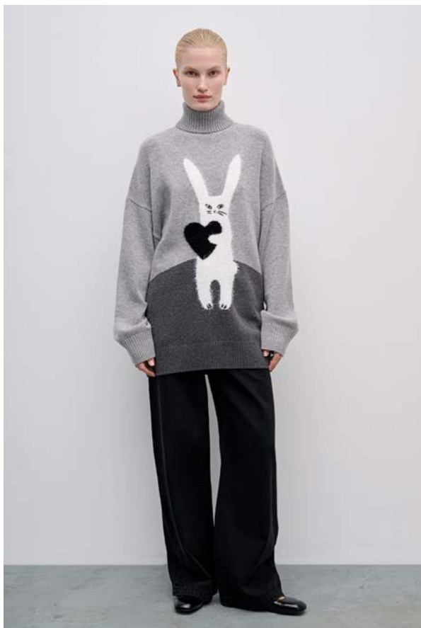
ДЖЕМПЕР АРТИКУЛ: 3816/809 СОСТАВ: 35% НЕЙЛОН, 35% АКРИЛ, 27% ШЕРСТЬ, 3% АНГОРА ЦЕНА: 14 990 Р